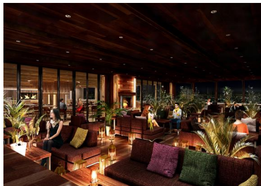
(ラウンジイメージ)